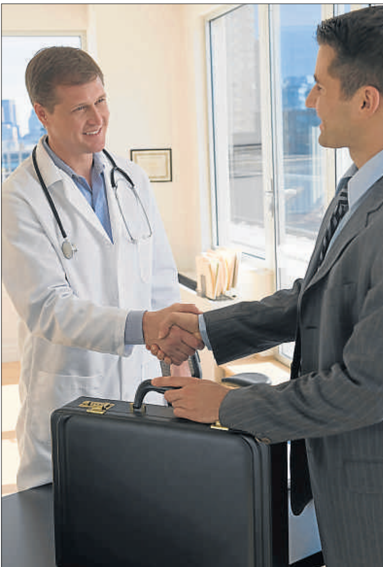
La figura del visitador médico ha perdido peso en el sector